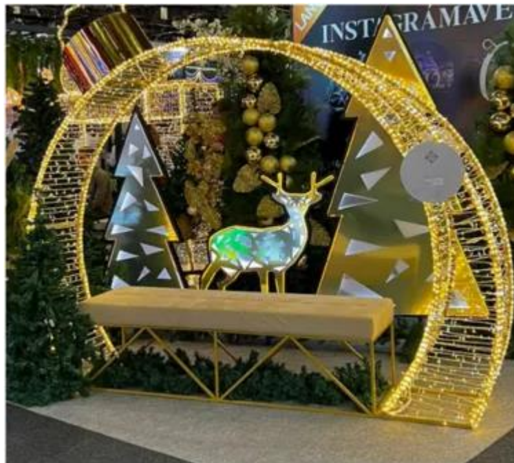
Figura 2: bola com banco instagramável