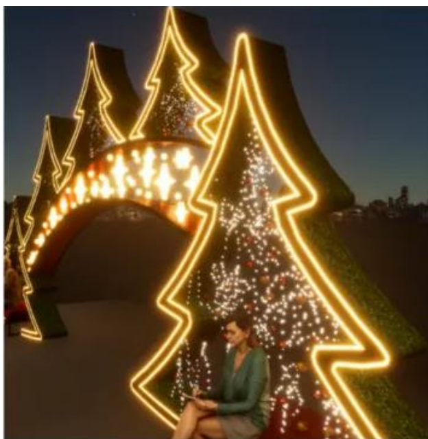
Figura 4: Figura arco com árvore e bancos