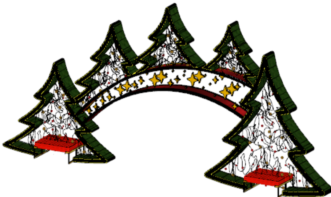
Figura 3: Esquema arco com árvore e bancos