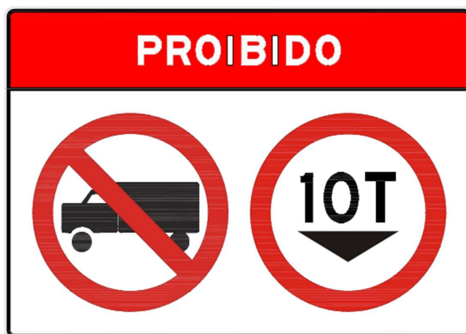
Figura 1: placa em aço modulada, dimensões: 2,40 m x 1,60 m