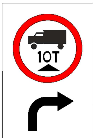
Figura 2: placa em aço, dimensões: 0,40 m x 0,60 m